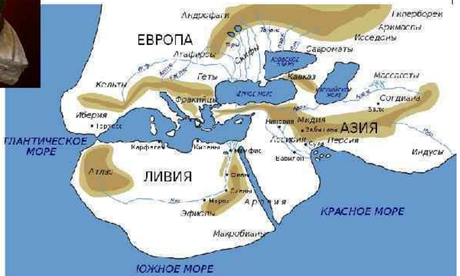
Мир с точки зрения Геродота.