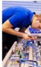
Подготовка квалифицированных служащих и специалистов ТОП-50