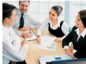
Подготовка специалистов среднего звена