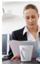
Дополнительные программы отпуски по уходу за ребенком