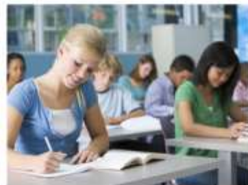
Подготовка на базе неполного среднего образования (9 кл)