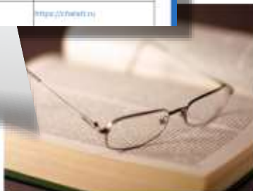
Обучение лиц с ограниченными возможностями здоровья