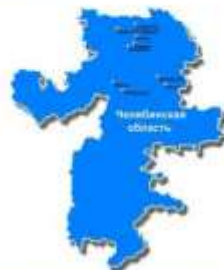
Профессиональные образовательные организации Челябинской области