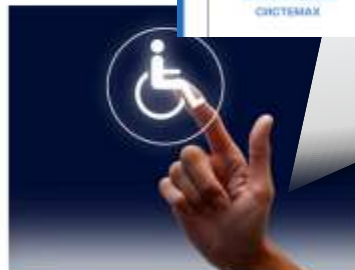
Обучение инвалидов с различными видами нарушений здоровья