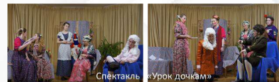
Спектакль «Урок дочкам»

Онлайн-уроки финансовой грамотности в колледже