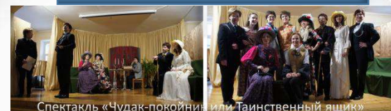
Спектакль «Чудак-покойник или Тайственный ящик»

Изучение финансовой грамотности на ошибках и успехах литературных героев