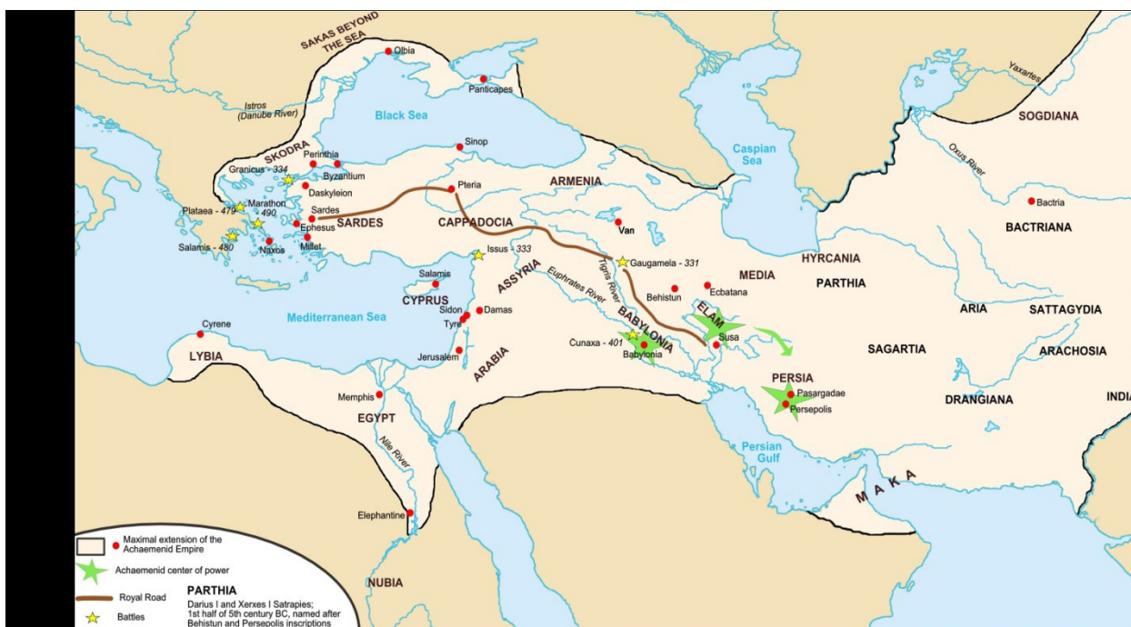
Карта державы Ахеменидов и Царской дороги.