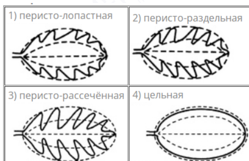
Рис. 3. Формы листа

Дети фотографировали объекты не только общим планом, но и крупным. Отдельно фотографировали листья. Обращали внимание на типы листьев, жилкование и формы листьев, на края листовых пластинок. Это важно для тех, кто через год в 9 классе будет сдавать экзамен по биологии.