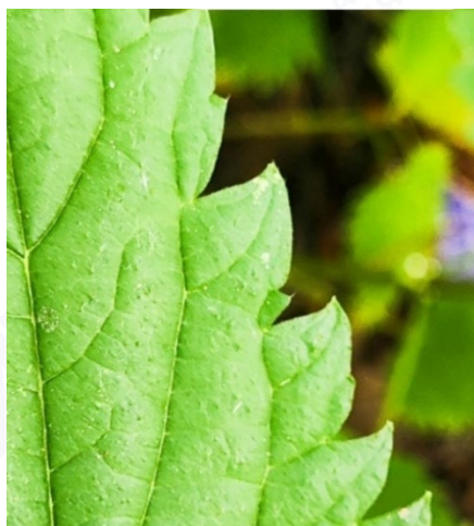
Рис. 4. Край листовой пластинки крапивы двудольной

В середине лагерной смены мы уже стали отмечать сезонные изменения у растений, фотографировать плоды и семена. Совместными усилиями нам удалось найти кусты княженики на нижнем участке, но ягод на них не было. В конце смены был организован выход группы в зеленую зону восьмого микрорайона. Выход группы – это целое событие, так как надо: