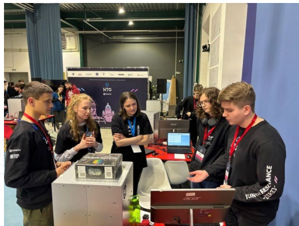
Рис. 1, 2.