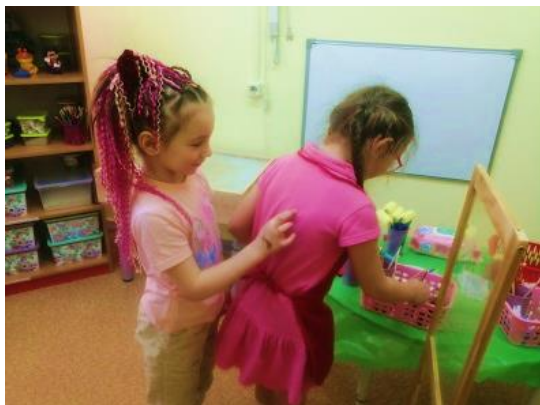
Рис. 7. «Рисуем на спине»

«Рисунок на спине» – развитие коммуникативных навыков, развитие тактильного восприятия, воображения (рис. 7, 8).