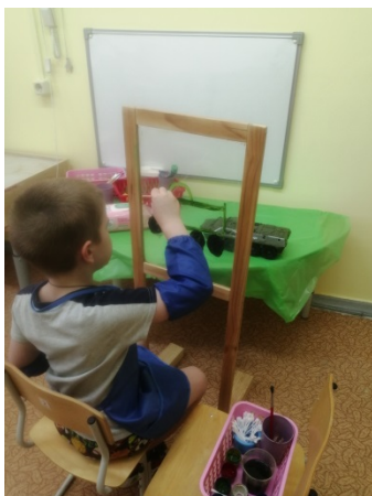
Рис. 6. «Рисуем с натуры»

«Рисуем с натуры» – развивает наблюдательность (рис. 6).