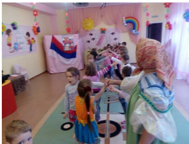
Рис. 2. «Подвижные игры Урала»

3. «Подвижные игры Урала» – дети познакомились и поиграли в игры народов, проживающих на Урале (рис. 2).