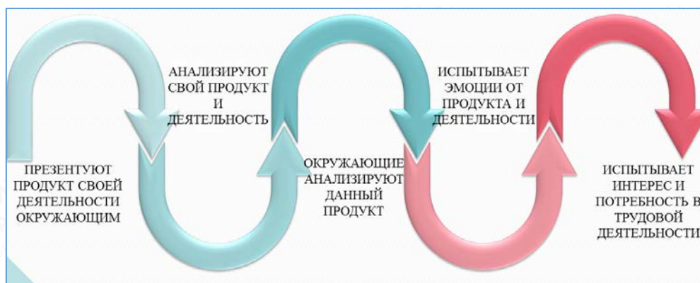
Рис. 5. Рефлексивный этап

3 этап «Рефлексивный». На рефлексивном этапе ребенок получает радость от работы и достигнутого результата, положительные эмоции. Проговаривает те качества, которые он приобрел, поработав в том или ином центре активности (мастерской). А самое главное – ребенок получает тот бесценный опыт, который он сможет применять и передавать в разных ситуациях (сделаю подарок, научу этому другого) (рис. 5).