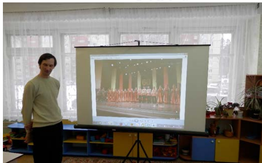
Рис. 4. «Горный ленок»

3. «Горный ленок» – папа воспитанницы детского сада, участник народного хора «Горный ленок» дворца культуры имени М. Горького АГО, показал детям видеопрезентацию о хоре народной песни, исполнил вместе со своей дочерью уральскую народную песню, которую разучил со всеми детьми (рис. 4).