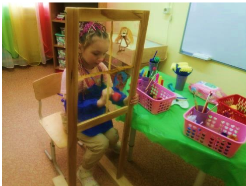
Рис. 10. «Радость»

«Рисуем стихи» – ребенку предлагалось послушать 4 коротких стихотворения «Радость», «Жалость», «Я плачу», «Я злой». Ребенок рисовал свой образ, свою ассоциацию к понравившемуся стихотворению (рис. 10).