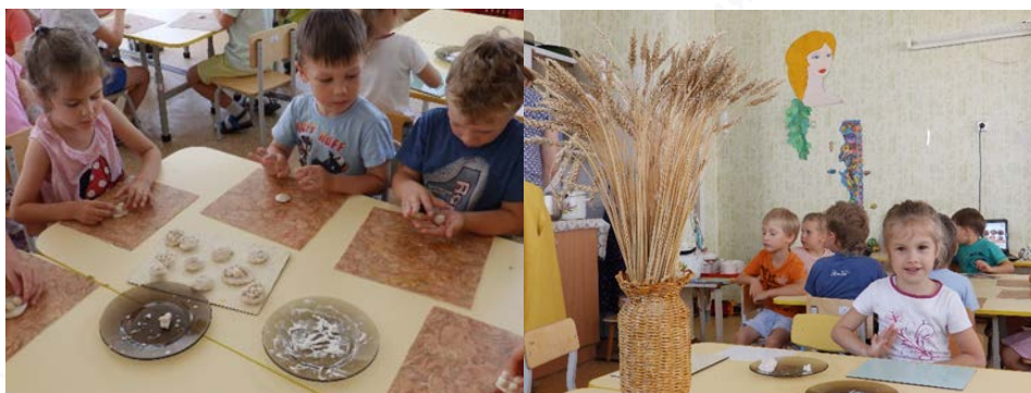
Рис. 7. «Хлебный Спас»

3. «Хлебный Спас» – детей познакомили с одним из народно-православных праздников «Хлебным Спасом» и его традициями. Затем дети из соленого теста стряпали хлеб (рис. 7).