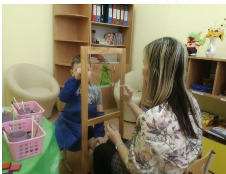
Рис. 3. Совместная работа с воспитанником, непосредственный контакт ребенок-педагог

Рисование на прозрачном мольберте в ходе коррекционно-развивающих занятий, раскрывает в детях то, что с помощью общения не всегда удастся. Рисуя на стекле, даже агрессивный, конфликтный ребенок получает возможность установить непосредственный контакт с другим человеком (с воспитателем или педагогом). В процессе совместной работы ребенок-ребенок, ребенок-взрослый – прозрачный арт-мольберт выполняет условно защитную функцию, когда легче установить контакт, вызвать ребенка на общение (рис. 3).