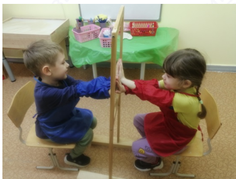
Рис. 4. «Здравствуй, друг»

«Здравствуй, друг», «Догони» – знакомство с прозрачным мольбертом, со свойствами стекла, развитие коммуникативных навыков, зрительно-моторной координации (рис. 4, 5).