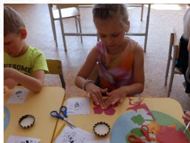
Рис. 5. Коллективная аппликация «Пчелки на цветочной поляне»

1. «Медовый Спас» – детей познакомили с Медовым спасом, показали презентацию, рассказали про Медовый спас, затем дети создали коллективную аппликацию «Пчелки на цветочной поляне» (рис. 5).