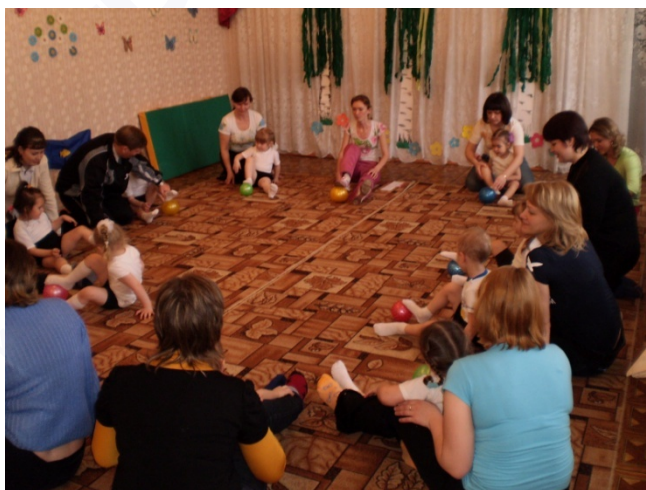
Рис. 1. Включение родителей в образовательный процесс

Еще одним трендом просветительской деятельности родителей стало осознание значимости развития различных навыков у детей. Современные родители все больше понимают, что важно не только развивать интеллект своих детей, но и их эмоциональную, социальную и физическую сферы. Они активно ищут методики и программы, которые помогут детям стать компетентными и успешными во всех аспектах жизни [5].