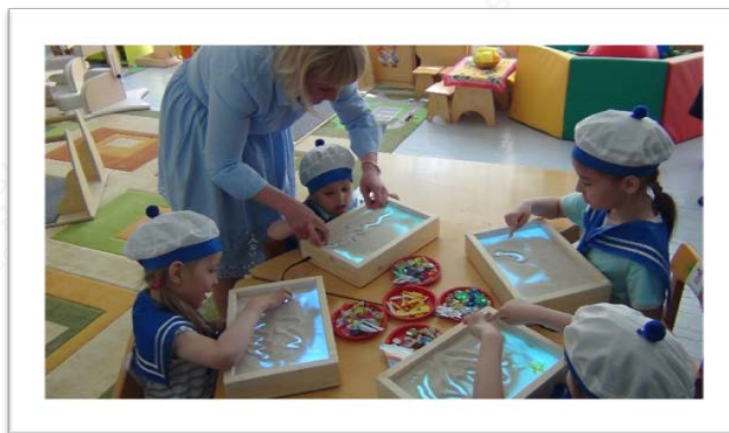
Рис. 3. Центр игровой поддержки и социальной интеграции «Игралочка»

комплекса средств адаптивной физической культуры, которая позволяет повысить эффективность непосредственно образовательной деятельности, что положительно повлияет на физическое, психическое и эмоциональное благополучие детей;