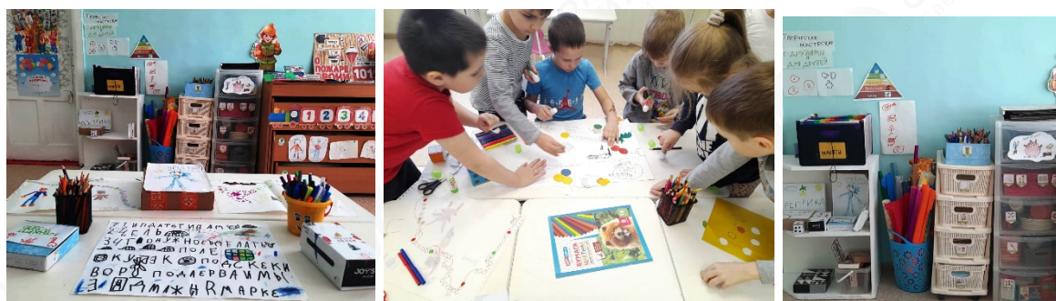
Рис. 1. Творческая лаборатория «С друзьями и для друзей»

В процессе создания игры, наряду с развитием умения общаться, у детей развивается логическое мышление, аналитические способности, фантазия, умение планировать свою деятельность и доводить начатое дело до конца (рис. 1).