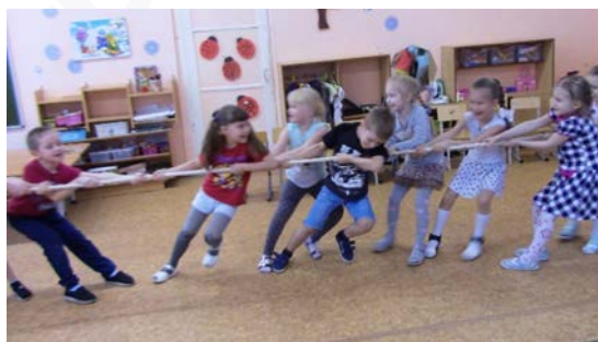
Рис. 9. «Русские народные игры»

2. «Масленичное солнышко» – непременно атрибутом Масленицы являются блины, которые олицетворяют солнце – символ того самого уюта и тепла, ну и, конечно, веселья. Детям предоставили возможность создать собственное солнышко (рис. 10).