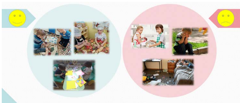
Рис. 1. Трудовая деятельность детей дошкольного возраста

На сегодняшний день проблемы трудового воспитания достаточно актуальны для детей дошкольного возраста, так как на этом этапе происходит формирование нравственных и культурных ценностей, в том числе такой ценности, как «труд». В раннем возрасте ребенок, подражая взрослому, с удовольствием выполняет трудовые действия. В старшем дошкольном возрасте труд для детей становится скучным и неинтересным занятием, поскольку они не знают, как выполнять то или иное задание. И мы, взрослые, в свою очередь, спешим сделать все сами, хорошо и быстро, не давая детям возможности поучаствовать, проявить инициативу, тем самым воспитывая потребителей (рис. 1).