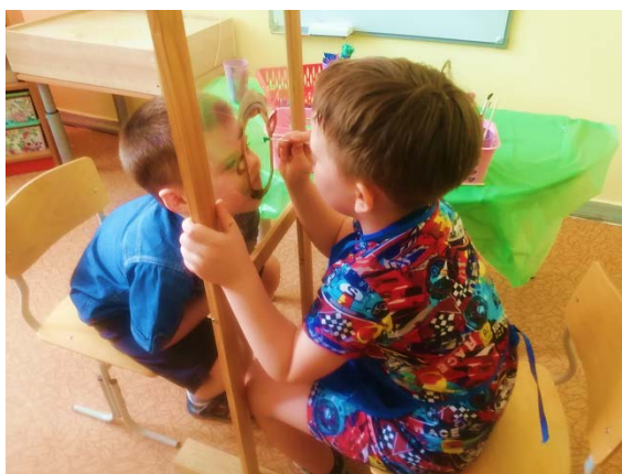
Рис. 9. «Портрет»

«Рисуем портрет» – развитие коммуникативных навыков, снятие эмоционального напряжения (рис. 9).