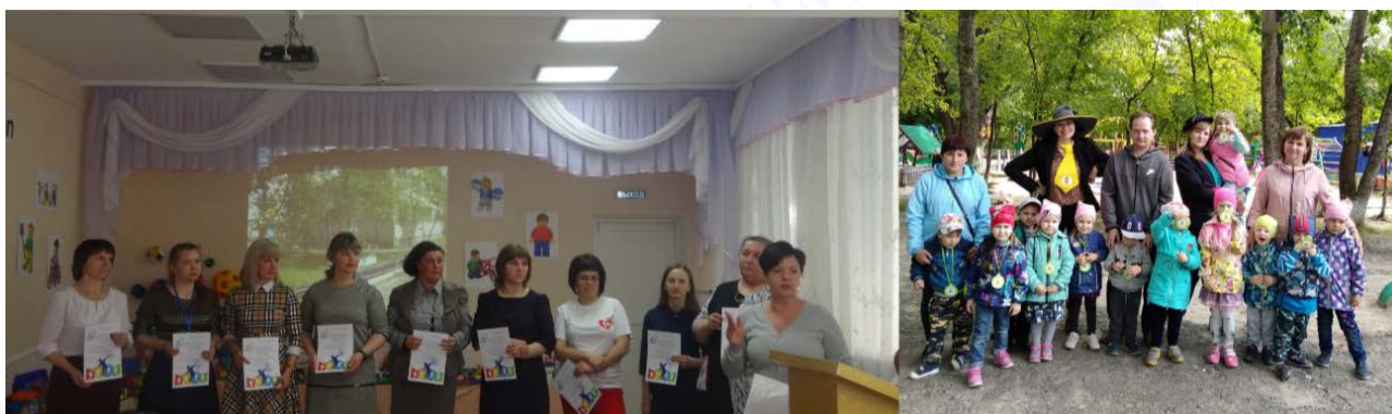
Рис. 2. Взаимодействие педагогов и родителей

Взаимное уважение и доверие составляет основу эффективного взаимодействия педагогов и родителей (рис. 2). Если раньше в ходе традиционных форм взаимодействия родители занимали позицию наблюдателей, слушателей, зрителей, то современные формы взаимодействия направлены на формирование активности, инициативности и родительской ответственности – субъектной позиции родителей, заинтересованных жизнью ребенка в детском саду.