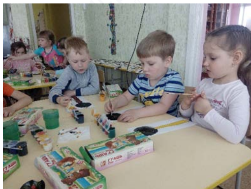
Рис. 3. «Урало-сибирская роспись»

1. «Урало-сибирская роспись» – где детей познакомили с незаслуженно забытым промыслом нашего края – урало-сибирской росписью, ее основными элементами и применением (рис. 3).