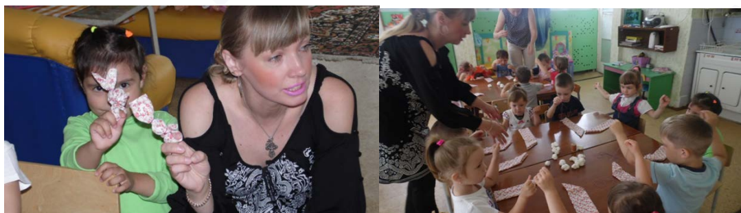
Рис. 8. «Кукла своими руками»

Клубный час: «Широкая масленица» , целью которого стало создание условия для приобщения дошкольников к русским народным праздникам через различные виды деятельности. В рамках данного клубного часа были организованы тематические клубы.