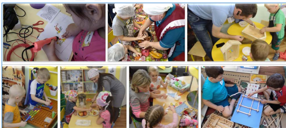
Рис. 4. Трудовая деятельность в «ремесленной мастерской»

3 этап «Рефлексивный». На рефлексивном этапе ребенок получает радость от работы и достигнутого результата, положительные эмоции. Проговаривает те качества, которые он приобрел, поработав в том или ином центре активности (мастерской). А самое главное – ребенок получает тот бесценный опыт, который он сможет применять и передавать в разных ситуациях (сделаю подарок, научу этому другого) (рис. 5).