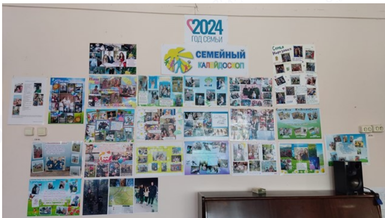
Рис. 5. 2024 год Семьи: «Семейный калейдоскоп»

Наконец, важно повышать мотивацию родителей к участию в общественно-государственном управлении образовательными системами. Родители должны осознавать свою роль в образовании своих детей и активно сотрудничать с образовательной организацией. Их участие позволяет создать условия для обеспечения качественного образования и благоприятной среды для развития детей.