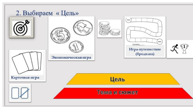
Рис. 4. Второй этап алгоритма создания игры «Пирамида Мастера игры»

3. После того, как цель выбрана, нужно определить, как нам ее достичь или как ходить. Это «Действия» (переворачивать карточки, бросать кубик, передвигать фишки и т. д.) (рис. 5).