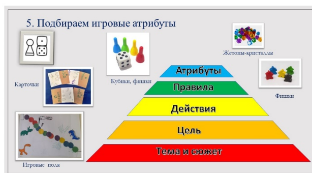
Рис. 7. Пятый этап алгоритма создания игры «Пирамида Мастера игры»

6. Важнейшим условием эффективной работы по развитию детской инициативы – взаимодействие с семьями воспитанников.