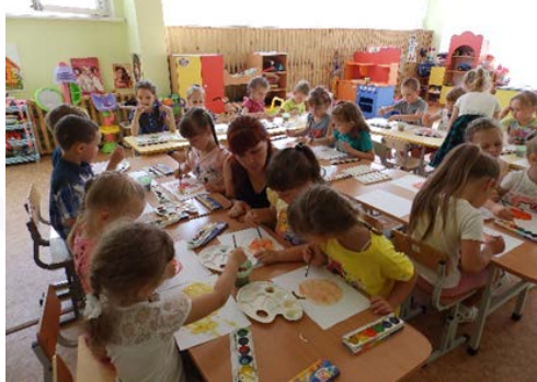
Рис. 6. «Яблочный Спас»

2. «Яблочный Спас» – детей познакомили с народным праздником «Яблочный спас». Затем дети, смешивая разные краски, рисовали «яблоко» (рис. 6).