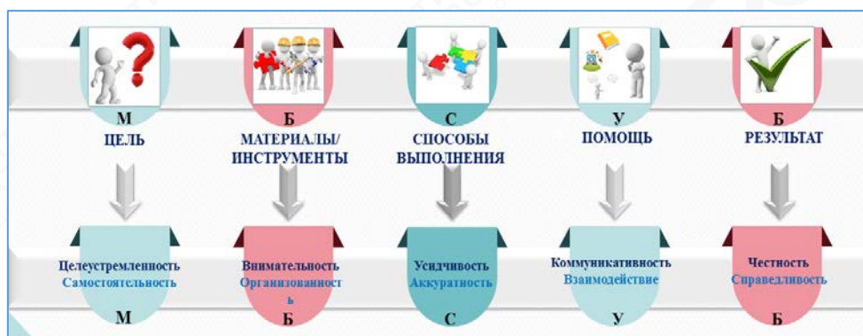
Рис. 2. Модель «Дружные ладошки»