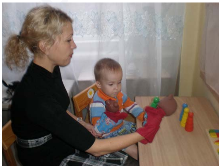
Рис. 2. Коррекционно-развивающая работа учителя-логопеда