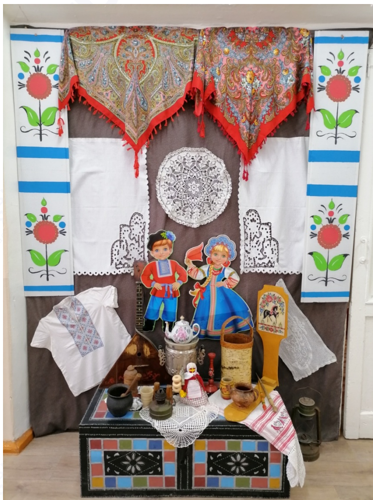
Рис. 3. Поддержка семейных традиций и ценностей семьи

Успешно реализован долгосрочный проект «Семейные ценности» (рис. 4). В ходе которого решились следующие задачи: