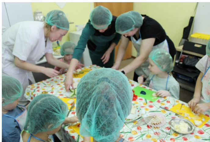
Рис. 1. Учимся готовить

В процессе образовательной деятельности используются проблемные ситуации, детское экспериментирование, сюжетно-ролевые игры, здоровьесберегающие и информационно-коммуникационные технологии. Содержание деятельности распределено по 4 блокам: «Учимся готовить» (рис. 1), «Учимся шить», «Учимся мастерить», «Мы конструируем» (рис. 2).