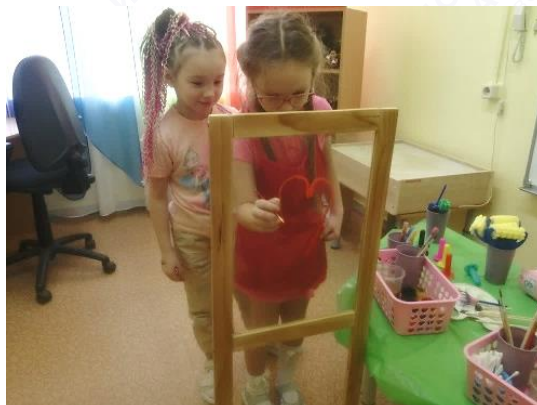
Рис. 8. Перенос рисунка на мольберт

«Рисуем портрет» – развитие коммуникативных навыков, снятие эмоционального напряжения (рис. 9).