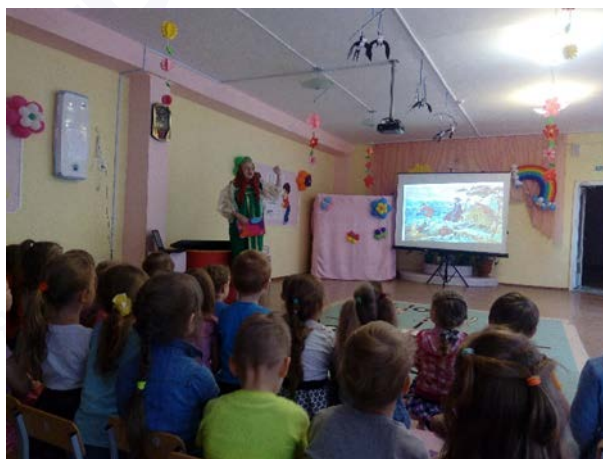
Рис. 1. «Урал – опорный край державы»

2. «Малахитовые бусы» – детям читали отрывки из сказа «Малахитовая шкатулка», затем они изготовили из пластилина украшения «Малахитовые бусы».