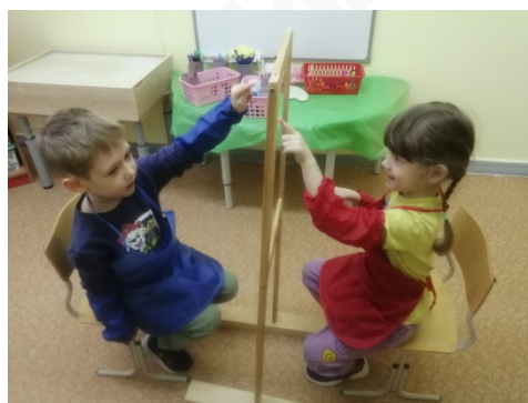
Рис. 5. «Догони»