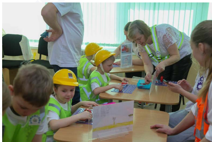
Рис. 2. Мы конструируем

Каждый блок состоит из тем, расположенных по сложности изучаемого материала с увеличением доли практических занятий. Каждое занятие состоит из двух частей – теоретической и практической. И подразумевает погружение в профессии: повар, кондитер, швея, портной, конструктор и дизайнер одежды, столяр, плотник, электромонтер, программист. В течение нескольких месяцев дети знакомились с кухонными помощниками, бытовыми приборами, сервировали стол к разным событиям, осваивали умение готовить бутерброды, собирали коллекции пуговиц, учились их пришивать. Держали в руках отвертки, дрели, много узнали о разнообразии пород древесины и ее свойствах, знакомились с измерительными приборами, читали схемы. Работая с конструктором «Зна-ток», узнали об электрических схемах, способах соединения и принципе их работы. Главными гостями у детей были родители, представители данных профессий. Родители смогли увлекательно представить особенности своих профессий.