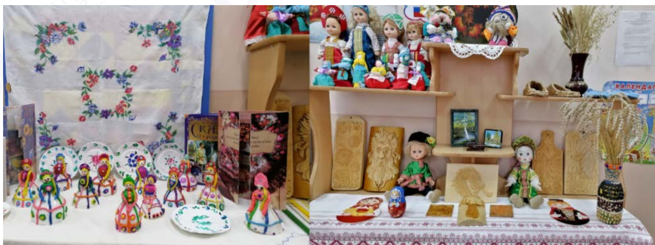
Рис. 4. Поддержка семейных духовно-нравственных ценностей

Наконец, важно повышать мотивацию родителей к участию в общественно-государственном управлении образовательными системами. Родители должны осознавать свою роль в образовании своих детей и активно сотрудничать с образовательной организацией. Их участие позволяет создать условия для обеспечения качественного образования и благоприятной среды для развития детей.