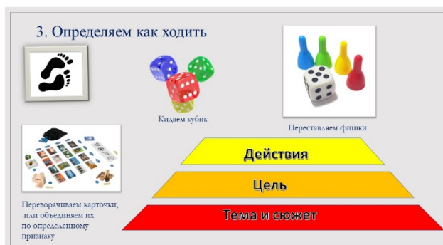
Рис. 5. Третий этап алгоритма создания игры «Пирамида Мастера игры»

3. После того, как цель выбрана, нужно определить, как нам ее достичь или как ходить. Это «Действия» (переворачивать карточки, бросать кубик, передвигать фишки и т. д.) (рис. 5).