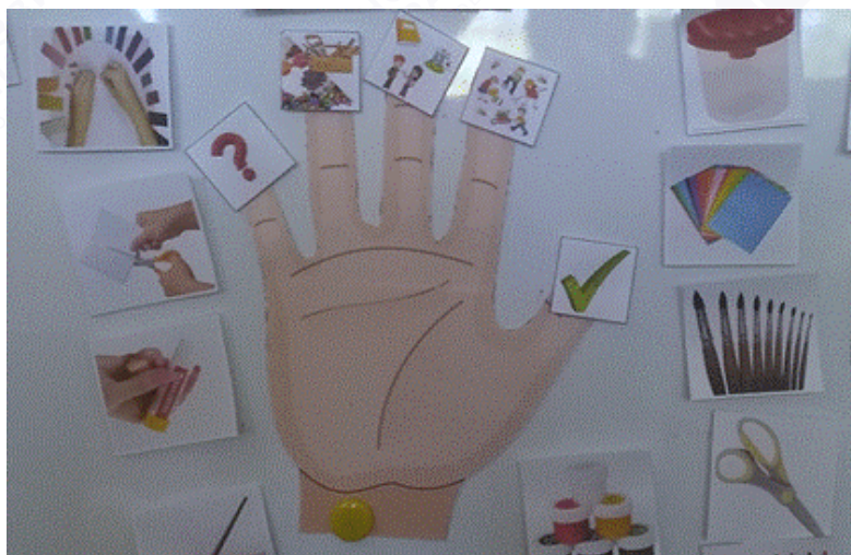
Рис. 3. Графическое изображение планирование трудовой деятельности в «ремесленной мастерской»

На этом этапе идет работа с моделью «Дружные ладошки», которую начинаем применять с детьми возрастной группы от 4 до 5 лет. В этом возрасте используется графическое изображение руки и картинки с трудовыми понятиями для планирования трудовой деятельности (рис. 3). Когда дети овладели умением планировать трудовую деятельность с помощью графического изображения «дружных ладошек», используются лишь понятия (дети от 5 до 7 лет).