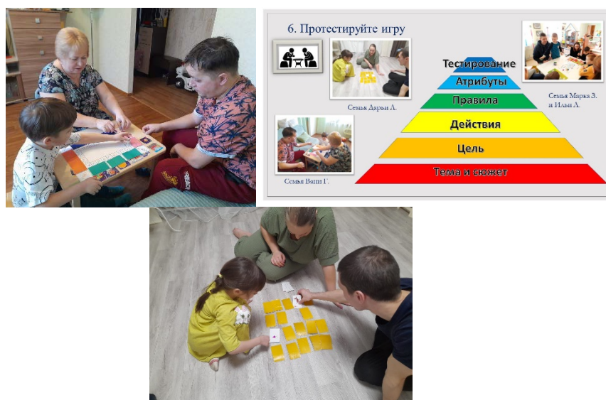
Рис. 8. Этап «Тестирование»

Для вовлечения родителей в образовательный процесс, развития ответственного и осознанного родительства как базовой основы благополучия семьи, в алгоритм создания игры включен этап «Тестирование» (рис. 8). Все созданные игры дети тестируют дома с родителями. Поиграв всей семьей, родители делятся с нами впечатлениями, вносят предложения по усложнению или корректировке игры.