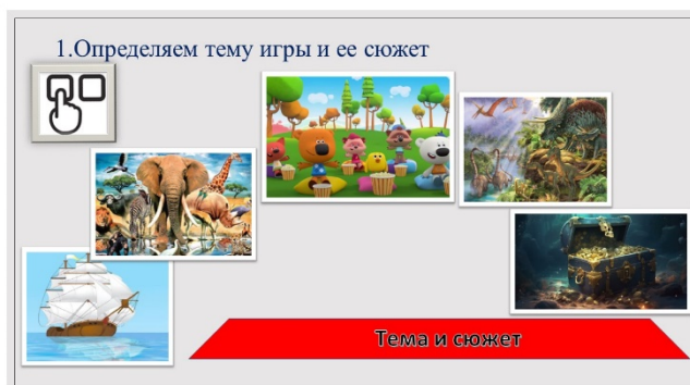
Рис. 3. Первый этап алгоритма создания игры «Пирамида Мастера игры»

1. Создавая игру, дети первым делом определяют тему игры и ее сюжет. Это может быть морское путешествие, мир животных и все, на что хватает фантазии (рис. 3).