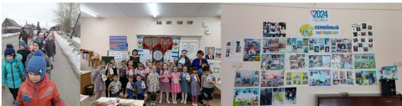
Рис. 6. Реализация технологии коллективного творческого

В своей работе мы провели различные театральные постановки, которые увлекли и детей, и взрослых. Семейные газеты стали прекрасным проектом, объединяющим родителей и детей в создании необычных изданий, наполненных историями, фотографиями и креативными иллюстрациями. Совместно с родителями мы также изготовили и установили кормушки для птиц, превращая обыкновенные занятия в увлекательные мастер-классы на свежем воздухе. Эти мероприятия не только способствуют развитию творческих способностей и интересов у детей, но и усилили семейные связи, привлекая родителей к активному участию в жизни дошкольного учреждения.