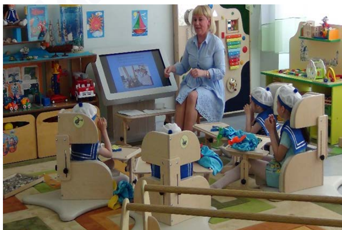
Рис. 1. Коррекционно-развивающая работа педагога-психолога