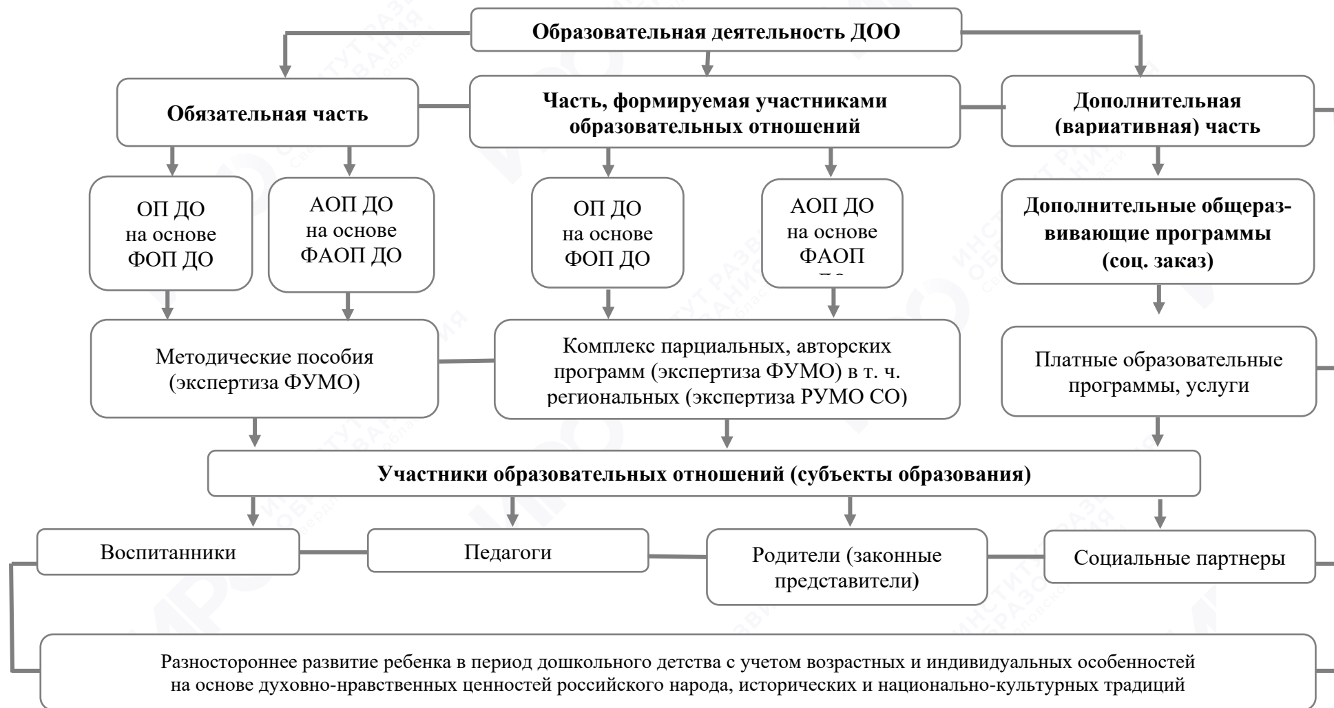
Рис. 1. Модель образовательной деятельности в ДОО в условиях реализации ФГОС ДО, ФОП ДО в едином образовательном пространстве