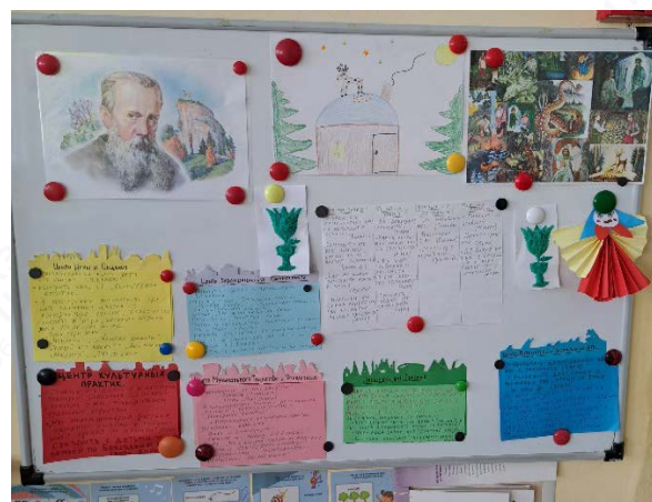
Рис. 2. Информационная панель Планирования и реализации планов.