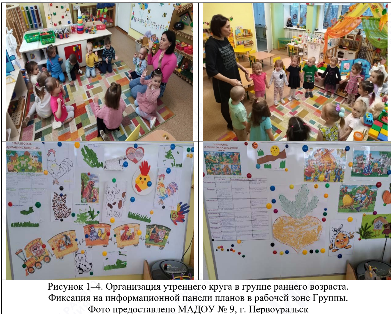
Рисунок 1–4. Организация утреннего круга в группе раннего возраста. Фиксация на информационной панели планов в рабочей зоне Группы.

Исходя из вышеизложенного, учитывая одно из главных новообразований дошкольного возраста – инициативность, как способность создавать замысел по собственному желанию и воплощать его, даже если для этого приходится преодолевать сопротивление ситуации (Эриксон Э.) педагогу особое внимание в ходе реализации ОП ДО уделяет новым формам планирования и организации образовательной деятельности, что не только будет способствовать решению образовательных задач, определенных ФОП ДО и парциальными программами, но будет способствовать личностному развитию ребенка, достижению целевых ориентиров ФГОС ДО, планируемых результатов ФОП ДО.