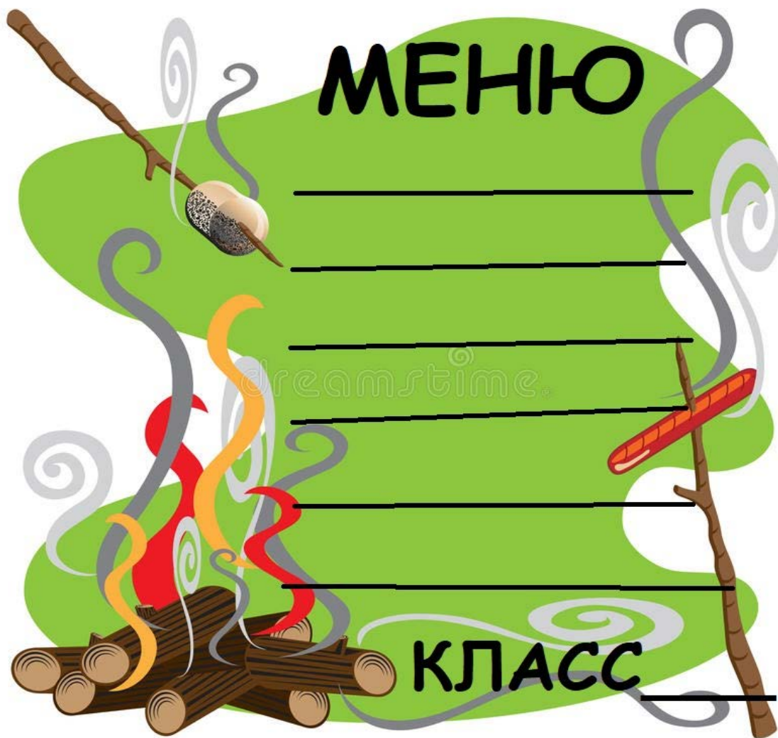
Рис. 7. Меню