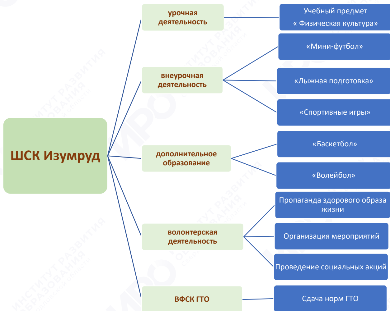
Рис. 1. Модель деятельности ШСК «Изумруд»

чающихся 5–11-х классов). Для каждой возрастной группы, каждой секции разработаны рабочие программы на учебный период. Занятия в клубе проходят в течение учебного года, включая каникулярное время (рис. 1).