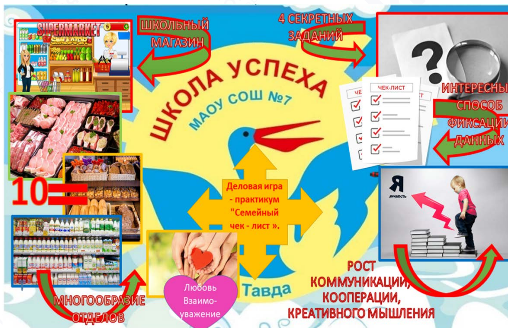
Рис. 1. Инфографика игры